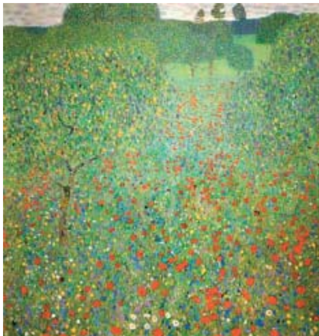
« Champ de coquelicots », 1907, Huile sur toile, 110x110, Osterreichische Galerie, Vienne